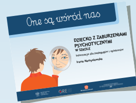
DZIECKO Z ZABURZENIAMI PSYCHOTYCZNYMI W SZKOLE