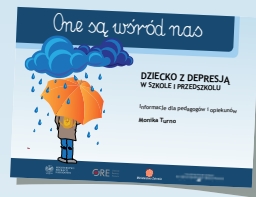
DZIECKO Z DEPRESJĄ W SZKOLE I PRZEDSZKOLU