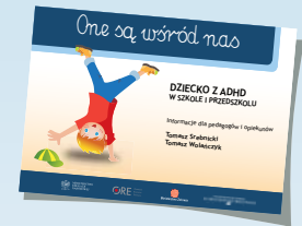
DZIECKO Z ADHD W SZKOLE I PRZEDSZKOLU