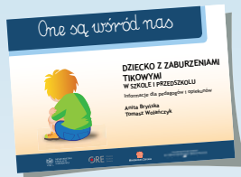
DZIECKO Z ZABURZENIAMI TIKOWYMI W SZKOLE I PRZEDSZKOLU

W drugiej serii „One są wśród nas” ukazały się: