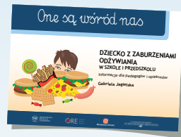
DZIECKO Z ZABURZENIAMI ODŻYWIANIA W SZKOLE I PRZEDSZKOLU