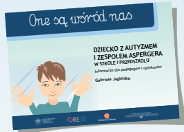
DZIECKO Z AUTYZMEM I ZESPOŁEM ASPERGERA W SZKOLE I PRZEDSZKOLU