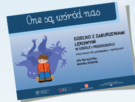
DZIECKO Z ZABURZENIAMI LĘKOWYMI W SZKOLE I PRZEDSZKOLU